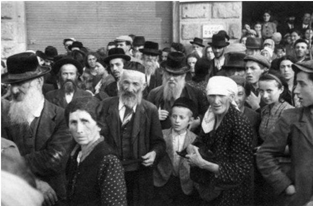
Judíos detenidos para realizar trabajos forzados, Przemysl, Polonia, octubre de 1939.

desarrollaron un plan para enviar a los judíos a la isla de Madagascar, frente a la costa sureste de África. Este plan tampoco resultó práctico. Sólo más tarde, una vez que los nazis comenzaron a implementar una política de asesinato masivo sistemático de judíos mediante la deportación a campos de exterminio, fueron deportados y asesinados los judíos que habían estado concentrados en los guetos. Un número menor fue deportado a campos de trabajo para ser explotados como mano de obra esclava.