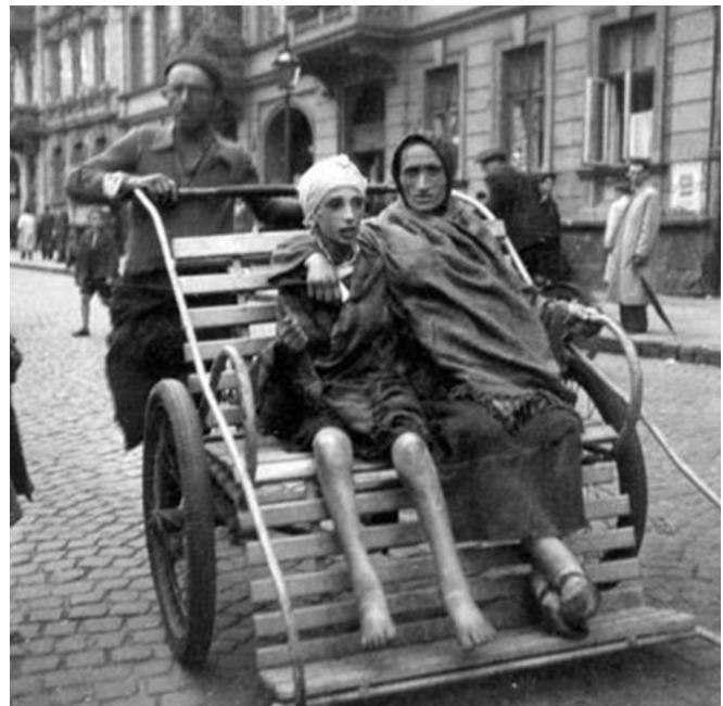
Dos mujeres hambrientas en un rickshaw, gueto de Varsovia, Polonia, 19 de septiembre de 1941. Archivo fotográfico de Yad Vashem (2536/85)

A la sombra del caos y el terror, muchos judíos intentaron conservar su humanidad y operar organizaciones de ayuda tal como lo habían hecho antes de la Segunda Guerra Mundial. A