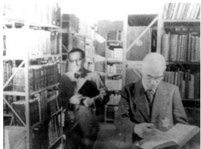
La Biblioteca, Theresienstadt, Checoslovaquia.

Al final, una vez que los alemanes desarrollaron un plan para la “Solución Final de la Cuestión Judía”, comenzaron a cerrar y liquidar los guetos. Deportaron a la mayoría de los judíos que quedaron con vida. La gran mayoría fueron asesinados en los campos de exterminio. Un pequeño porcentaje fue llevado a campos de concentración y trabajos forzados en las últimas etapas de la guerra. Al final de la guerra, cuando Europa fue liberada, no quedaba intacto ni un solo gueto, excepto el de Budapest.